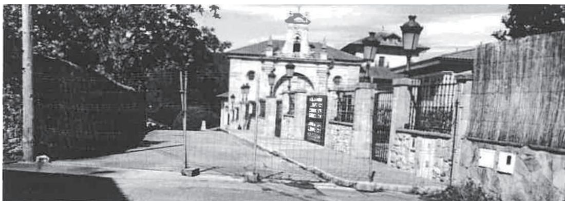
DOC 1. CAMINO PÚBLICO LA FUENTUCA (ORIENTACIÓN ESTE) CERRADO HACE MÁS DE UNA DECA DA

SEGUNDO. Al día de la fecha, el camino público de La Fuentuca sigue obstruido de forma palmaria y manifiesta. (DOCUMENTOS 1 y 2)