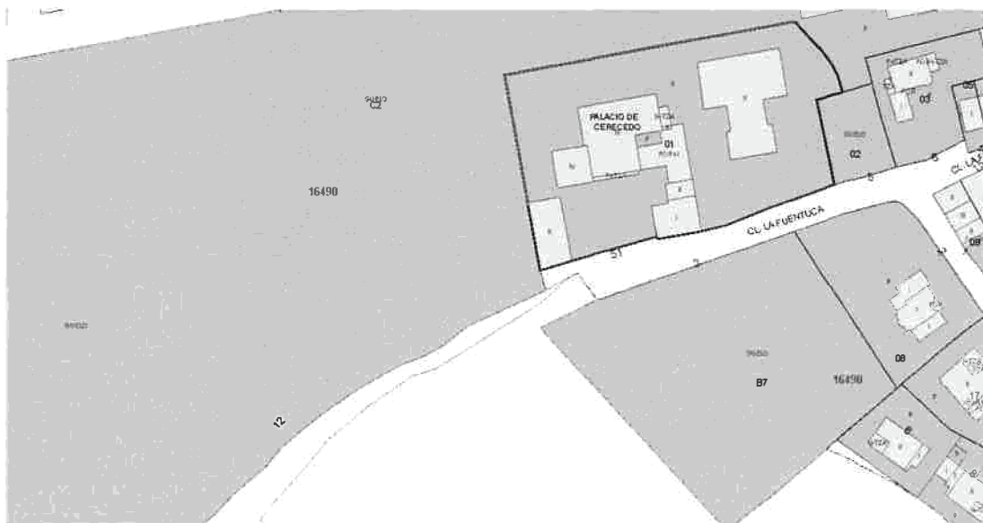
DOC 3. CALLE LA FUENTUCA (CATASTRO DE URBANA)

CUARTO. Visto el contenido del catastro de urbana (DOC 3) cuyo camino de la Fuentuca, mediante obras de urbanización se ha convertido en calle la Fuentuca y puesto en relación con el catastro de rústica de 1953 (DOC 4) y restos de pared medianera (DOC 5), se aprecia en dicho camino una presunta alteración jurídica de bienes de dominio público y, que en su caso, de haberse producido solamente estaría amparada legalmente por la aplicación del reglamento de bienes citado, cuyo art. 8.1 dice: La alteración de la calificación jurídica de los bienes de las Entidades Locales requiere expediente en el que se acrediten su oportunidad y su legalidad.