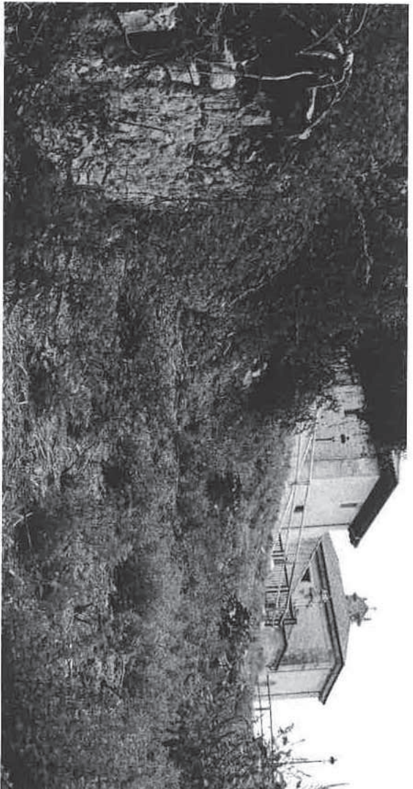
DOC 5. RESTOS DE PARED MEDIANERA EN CAMINO LA FUENTUCA