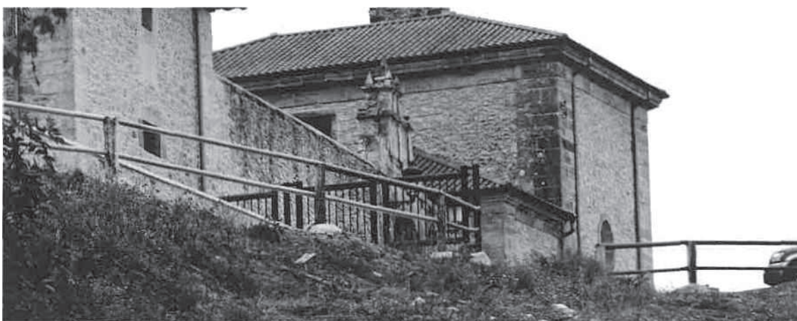
DOC 2. CAMINO PÚBLICO LA FUENTUCA (ORIENTACIÓN OESTE) CERRADO DESDE HACE VARIOS AÑOS

ACTA DEL PLENO Número: 2022-0007 Fecha: 28/09/2022